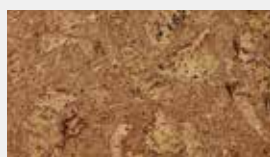
Ufenu Natur Dessin-Nr. 14104