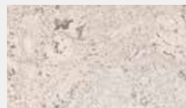
Corsica Crème Dessin-Nr. 14036