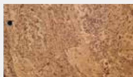
Spring Natur Dessin-Nr. 14102