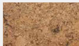
Corsica Natur Dessin-Nr. 14035