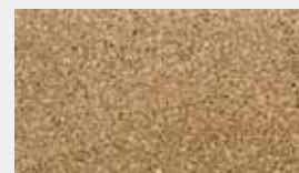
Swiss 400 Natur Dessin-Nr. 14038