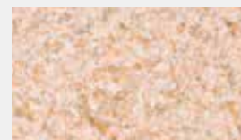
Swiss 400/971 Struktur