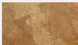
Marmor Natur Dessin-Nr. 14100