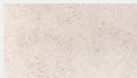
Marmor Crème Dessin-Nr. 14101