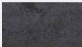
Marmor Rustic 360