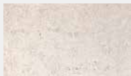
Spring Crème Dessin-Nr. 14103