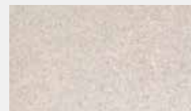
Swiss 400 Crème Dessin-Nr. 14039